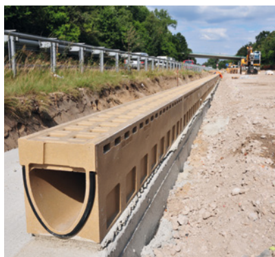
V-muotoilu tehostaa veden virtaamista