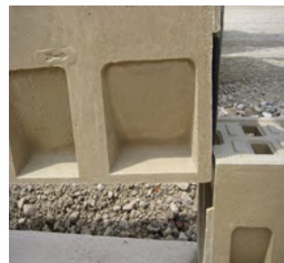
Asennus ylhäältä alaspäin