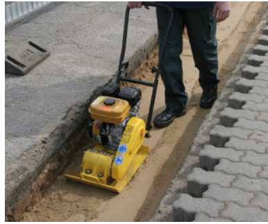
2. Tiivistä pohja niin tiiviiksi, ettei se painu