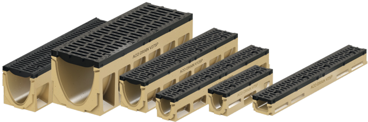
ACO DRAIN® PowerDrain V 75/100 P, V 125/150 P, V 175/200 P ja V 275/300 P