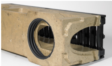
ACO DRAIN® PowerDrain V 75/100 P 0,5 m huulitiivisteellä