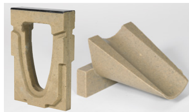
ACO DRAIN® PowerDrain suunnanvaihto-adaptteri ja porraskappale