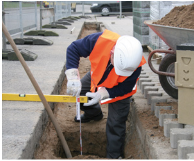
1. Mittaa ja kaiva kourulle ja asennusbetonille riittävä tila