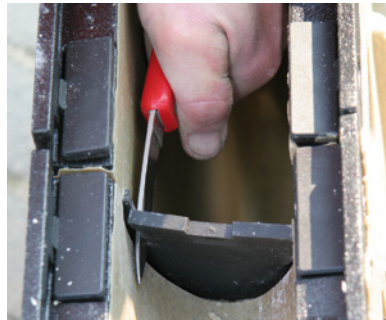
6. Lietelaatikon viereisten kourujen asennuksen jälkeen voit leikata lietelaatikon kumin pois kourun sisäpintaa myöden. Voit leikata kumin pois myös koko työn valmistuttua