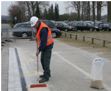
8. Saumaa kivetys valmiiksi