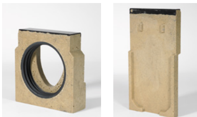
ACO DRAIN® PowerDrain poistollinen päätylevy sekä umpipääty