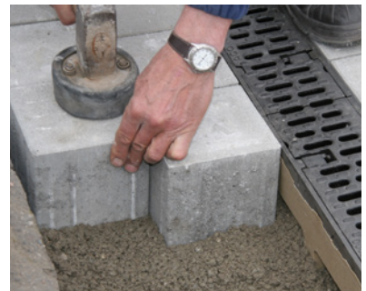
7. Asenna kourun viereen asennusbetonit ja varmista että betoni ja kivet ovat tiiviisti paikoillaan