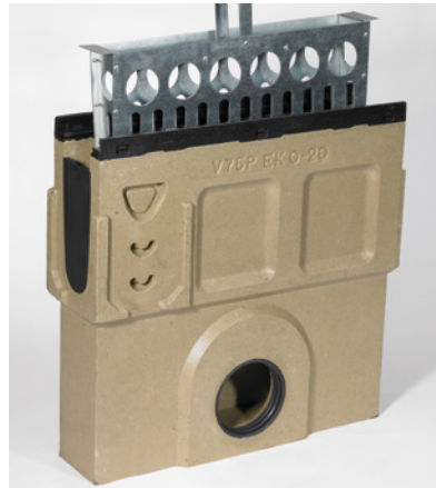
ACO DRAIN® PowerDrain -lietelaatikko