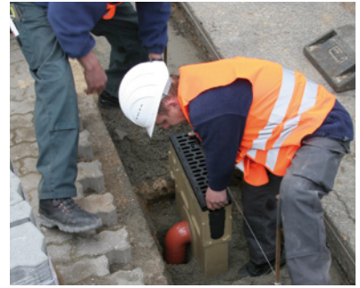
4. Asenna lietelaatikon alle kuormitusluokan vaatima asennusbetoni ja asenna lietelaatikko paikoilleen