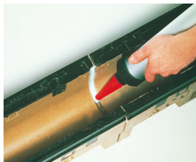
Asennuksen loppuksi voit saumata kourut. Tämä on välttämätöntä, jos kouruihin valuvassa vedessä voi olla maaperää liikaavia aineita.