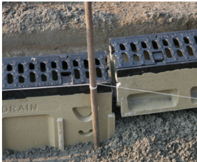
5. Asenna kourujen alle kuormitusluokan vaatima betonimäärä ja asenna kourut lietelaatikosta alkaen